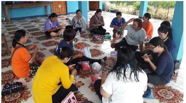
(กิจกรรม การทำไม้กวาดดอกหญ้า)